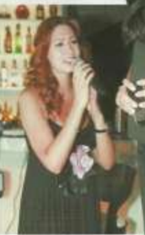
كريستال نور الملاح أنشأت مطعم الأساتذة إلى الأطباق اليابانية