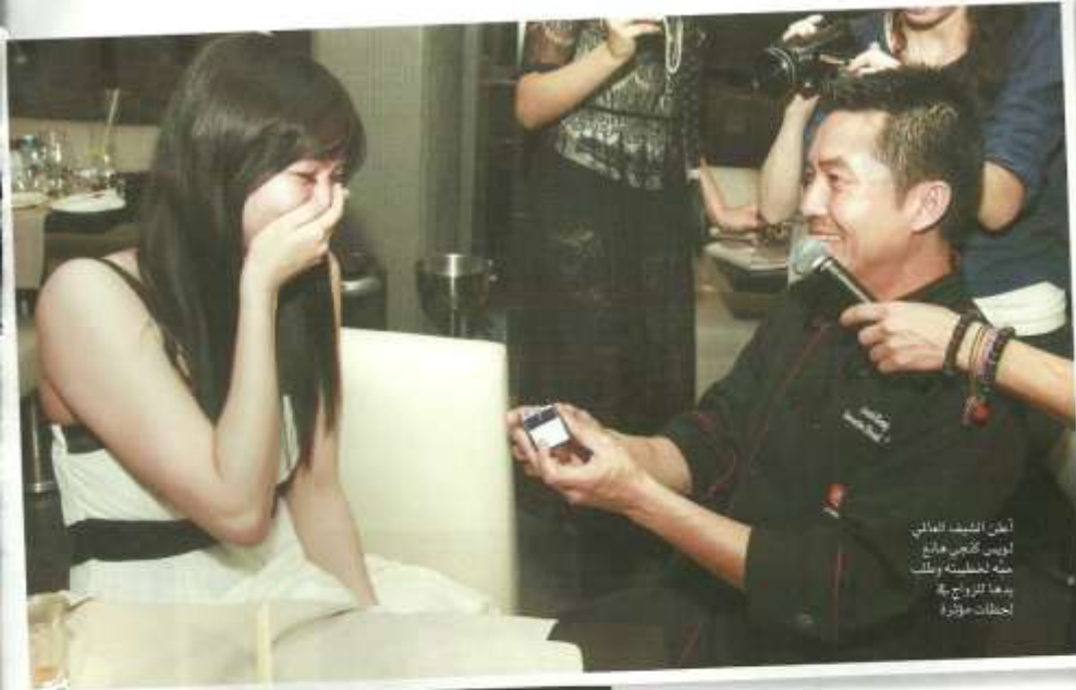
أطلق الشيفر الهادي لويس كاترين هادج جثة الخسيسة بطلب بدها الزواج في إحضان مؤثرة