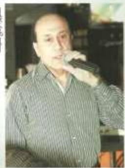
تؤدّق رواد Maki إضافة الشهيّة وأمازيهم صوت نور الملاح

أطلق مطعم Maki قائمة طعام جديدة تضمّت مجموعة كبيرة من الأطباق اليابانية الشعبية التي تجسّد المفاهيم التي يستند إليها Maki في عالم الطهو. واستمتع الحضور بالاستماع إلى الموسيقى الشرفيّة وتذوق الأطباق الأسبوعية. وتشمل القائمة الجديدة مفهوم البرغر اللذيذ الذي يجمع الـ Black بول الياباني و البرغر الأمريكي تحت اسم Black Angus Burger Soya Burger.